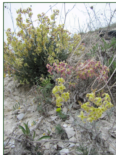
Matthiola odoratissima (M. Bieb.) R. Br.