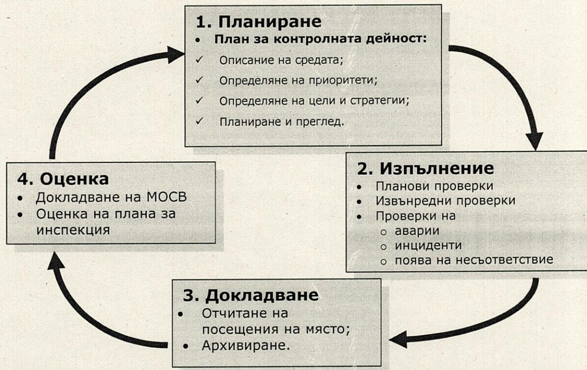
Фиг. 1 Цикъл на екологичната инспекция