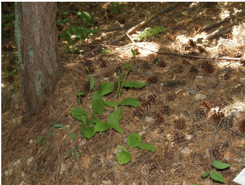
Добростански масив. Най-едрият екземпляр в популацията. Юли 2011 г., с плод.