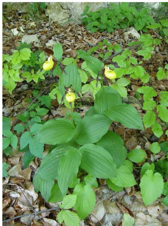
Фигура 2: Венерино пантофче, генеративен екземпляр с 3 стръка, два от които цъфтящи и единият с два цвята.