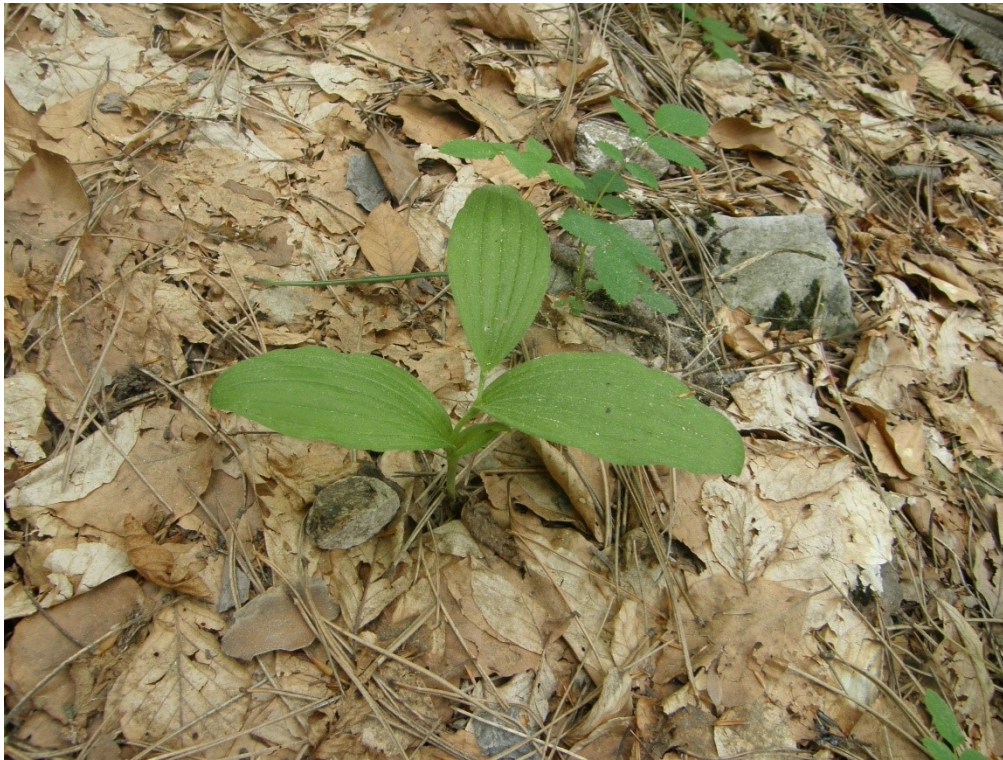
Добростански масив. Екземпляр с единичен стрък, във вегетативно състояние. Юни 2012 г.