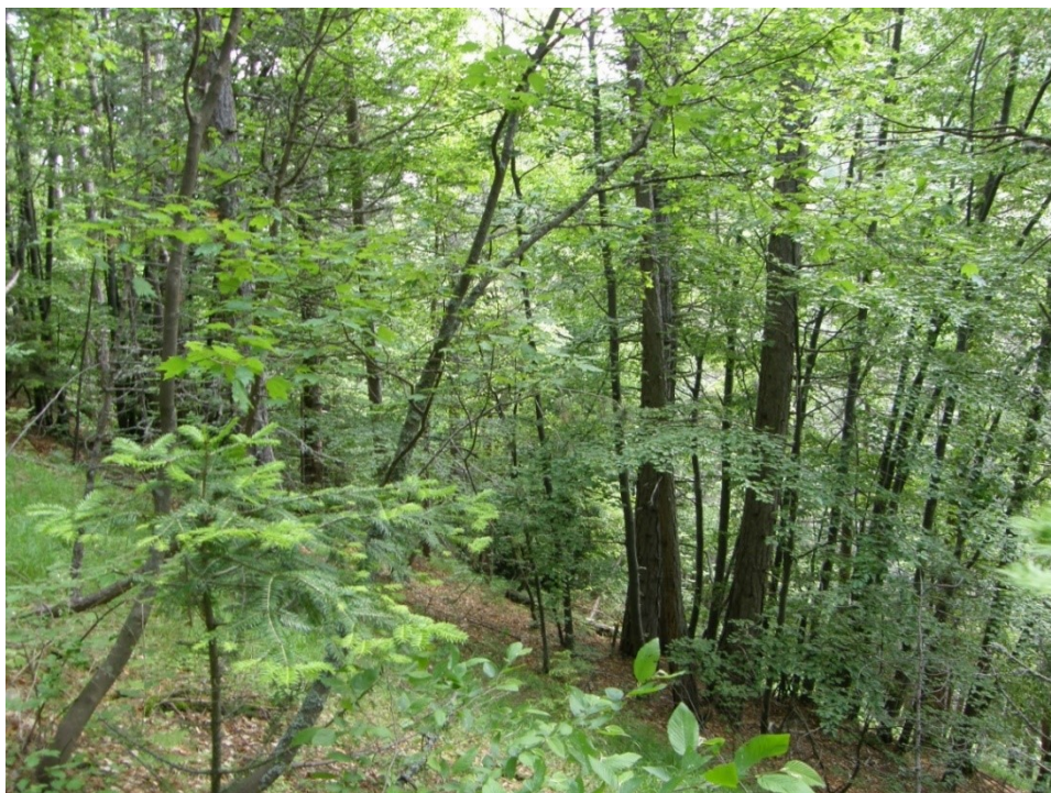
Добростански масив. Местообитание на вида. Юни 2014 г.