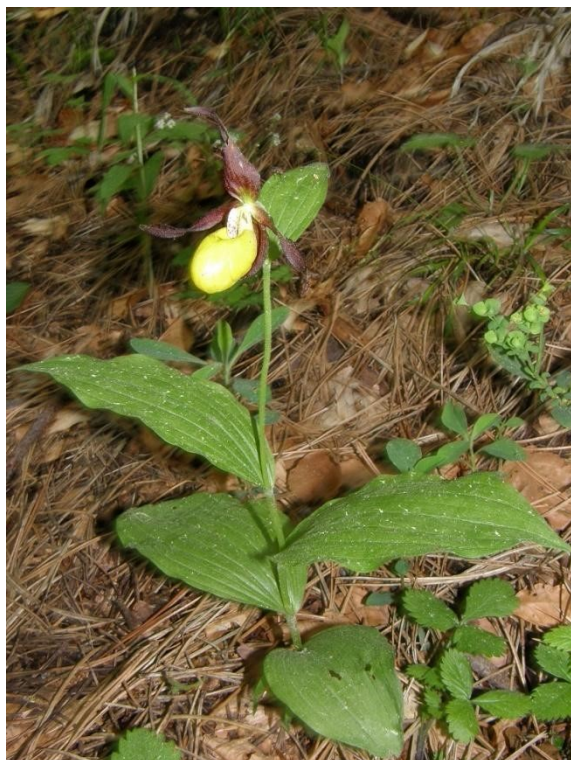
Фигура 1: Венерино пантофче ( Cypripedium calceolus ), генеративен екземпляр с един цъфтящ стрък.