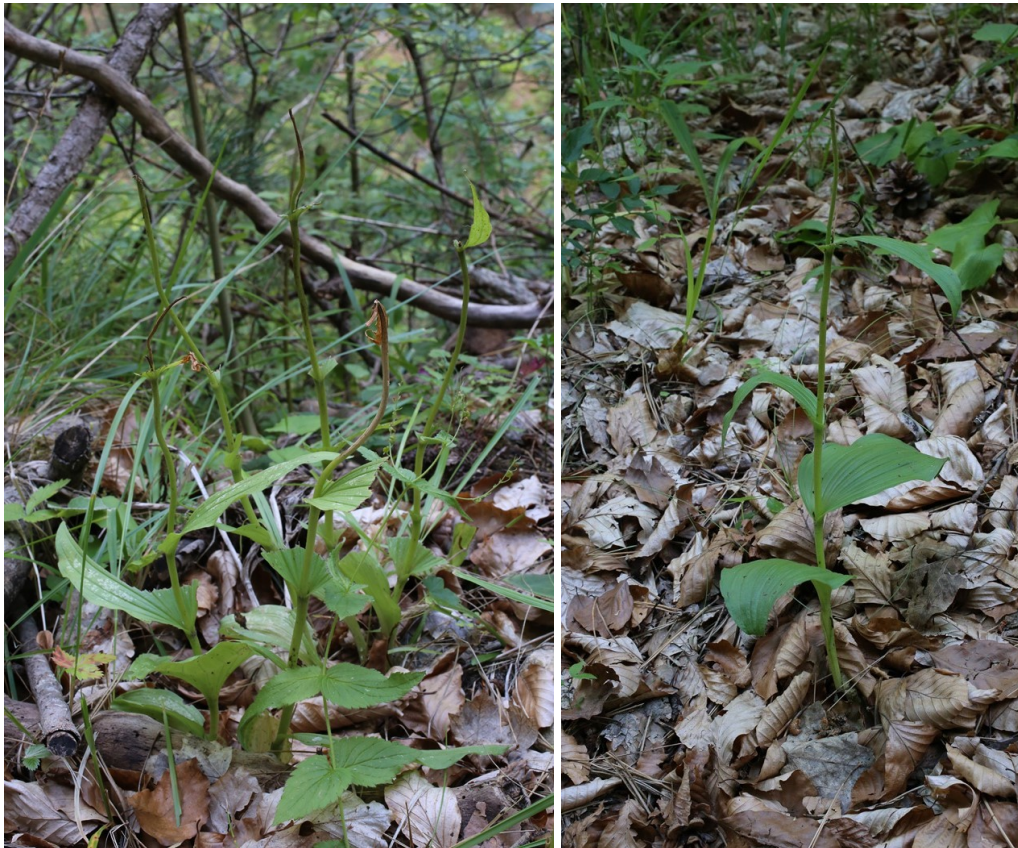
Изядени от охлюви (или насекоми) растения. Девинска планина, 07.2016 г.