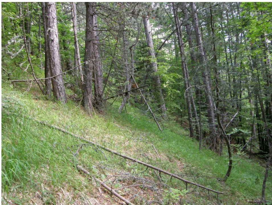
Добростански масив. Местообитание на вида. Юни 2014 г.