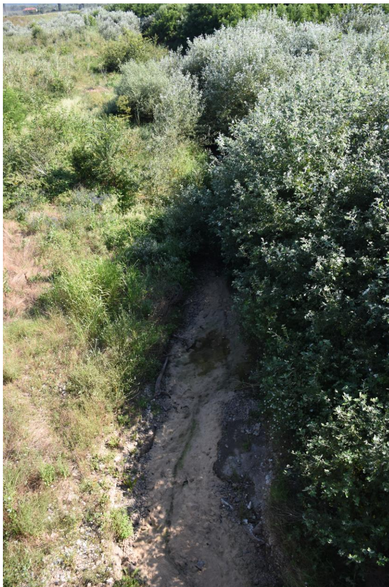
Фигура V.1-1: Характер на коритото на р. Левченска, местообитание 3260 съгласно МОЕВ (2022).

С приключване на строителството, водното течение на р. Каламица ще се възстанови, както и характеристиката на дъното. Това са предпоставки за бързото възстановяване (един до няколко вегетационни сезона) на макрофитната растителност, която е основната характеристика на местообитание 3260. Подобни речни екосистеми са изключително динамични, зависят от колебанията във водното ниво, които водят до различна скорост на течението в различни периоди, респ. до по-голяма динамика на седиментите, вкл. на характера на речното дъно. Чести са случаите на промяна на речното легло. Следвайки тези изменения, покритието на характерната растителност също може да се изменя драстично, което се определя и от биологичните характеристики на съставлящите я видове, приспособени към подобни изменения. Вегетативното размножаване при тях е силно застъпено, вкл. от части от растението, както напр. при видове от род Callitriche , при Myriophyllum spicatum , Ranunculus aquatilis (Цонева и кол. 2012). Така засегнатата площ на практика няма да има – реката се пресича от едноотворно съоръжение с дължина 8 м, като тя е по-тясна. В проекта няма предвидени други съоръжения в речното легло. Постоянна загуба на площи от местообитанието няма да има .