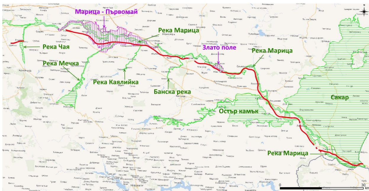
Фигура I.2-1: Местоположение на ИП (червена линия) спрямо защитените зони. Зелен хоризонтален щрих – ЗЗ по Директивата за хабитатите; лилав вертикален щрих – ЗЗ по Директивата за птиците.

Трасето на жп линията пресича и ЗЗ BG0000437 „Река Черкезица“, обявена по Директивата за местообитанията, но в този участък (Катуница – Поповица) съществуващото междугарие е електрифицирана двойна жп линия, която съответства на изискванията към проекта за удвояване и не са необходими проектни мероприятия. Респективно, в границите на зоната не се предвиждат никакви дейности. Реката, респ. зоната, се пресича изцяло чрез мостово съоръжение (Фиг. I.2-2).