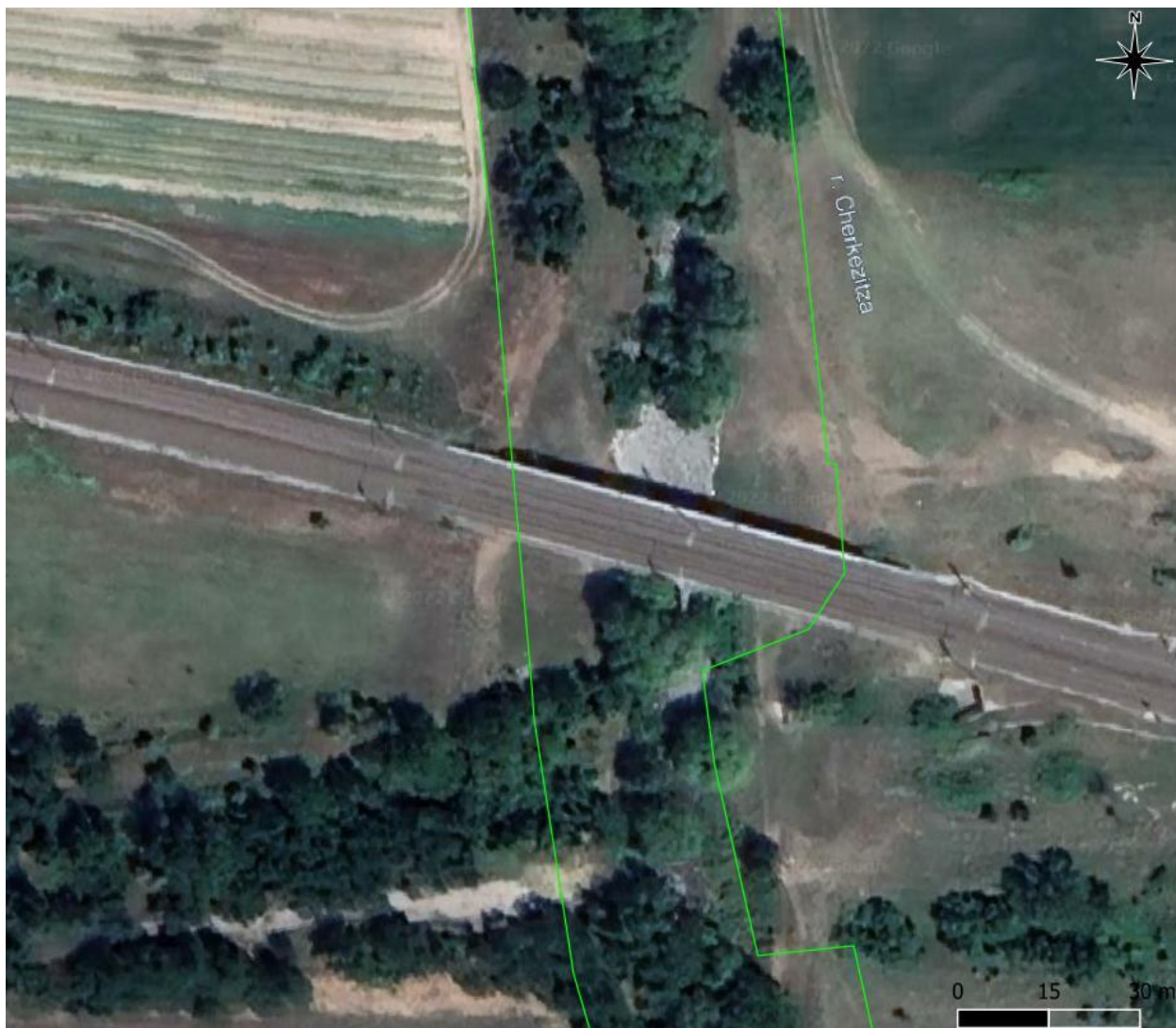
Фигура I.2-2: Пресичане на 33 „Река Черкезица“ (зелен контур) от съществуващата двойна, електрифицирана жп линия.