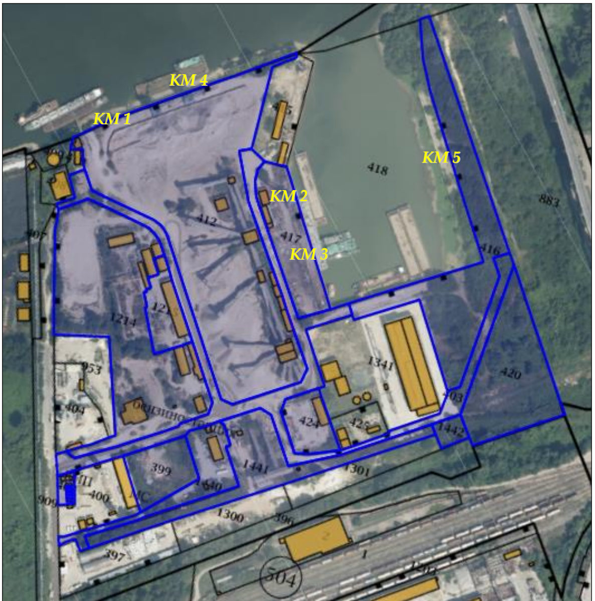
Фиг.2 Извадка от кадастралната карта на района с разположение на имотите на пристанище „Дунавски драгажен флот-Русе“, маркирани в синьо, както и разположението на KM1÷KM5