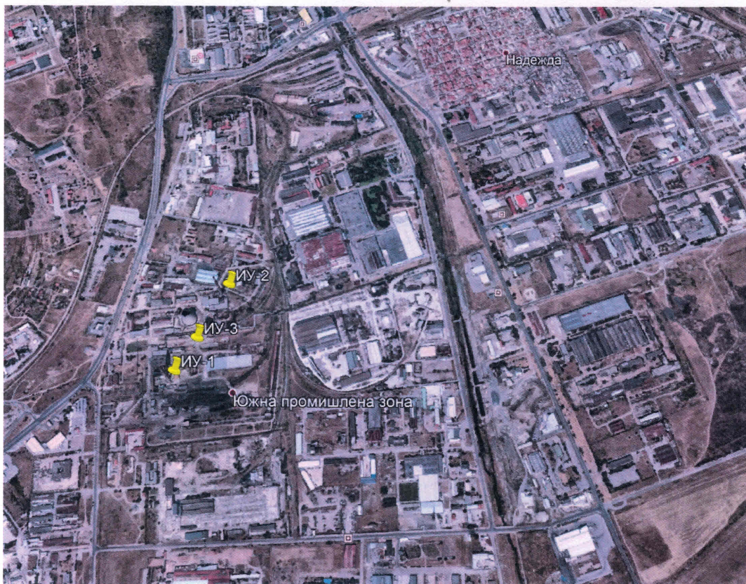
Фиг. 7-1 Местоположение на ИУ, разположени на територията на „Топлофикация - Сливен“ ЕАД, гр. Сливен

Определяне на НДЕ съгласно действащото екологично законодателство при различните режими на работа на инсталацията