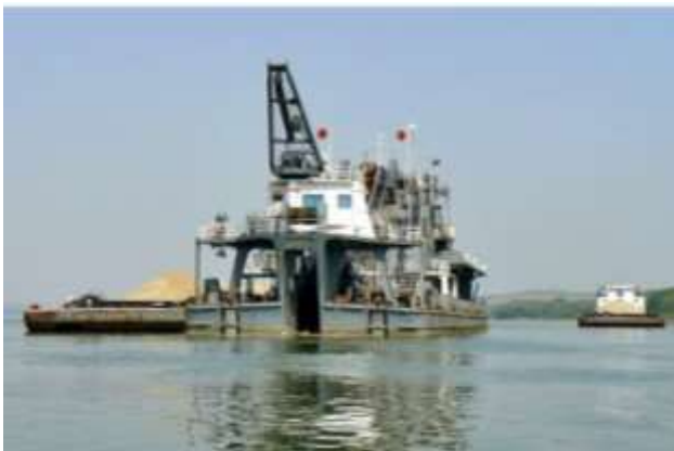
Снимка 1: Добив на наносни отложения с многокофова дълбачка

Повечето на брой участъци дава възможност за гъвкавост и избор на мястото за добив в зависимост от условията в реката. В някои от участъците, временно се изчерпват динамичните запаси, като за тяхното възстановяване са необходими около 1-2 години.