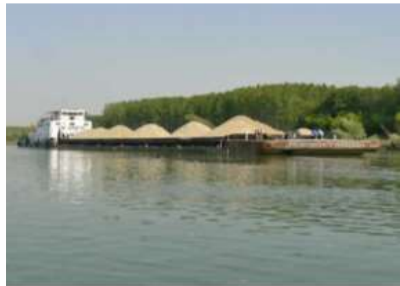
Снимка 2: Транспортиране на наносни отложения