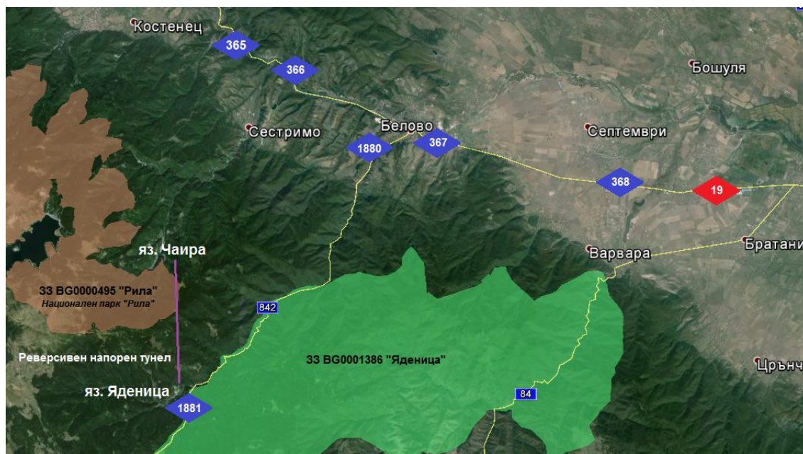
Фигура 1. Транспортна инфраструктура и преброителни пунктове на АПИ