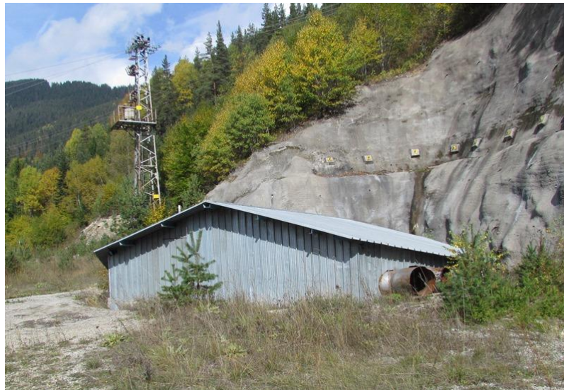
Фигура 7. Вход на проучвателната галерия в близост до бъдещата язовирна стена