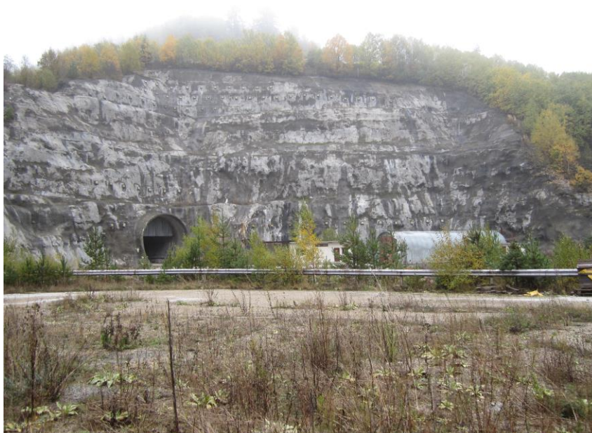
Фигура 9. Входът към реверсивния тунел от язовир "Яденица"

В участъка след язовирната стена надолу по течението на река Яденица не са извършвани строителни дейности. Там съществуват 2-3 малки вили и асфалтов път покрай реката. Самата река тече в естественото си корито, което е каменисто и заобиколено от растителност