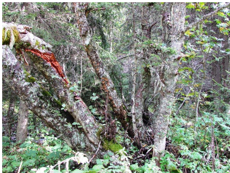
Фигура 4. Дървета във фаза на старост и гниеца дървесина на р. Яденица, непосредствено след бъдещата опашка на язовира