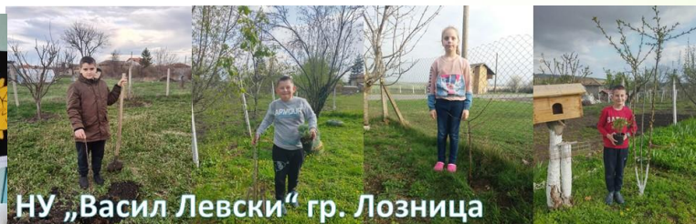
НУ „Васил Левски“ гр. Лозница