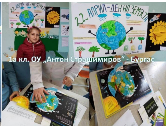
1а кл. ОУ „Антон Страшимиров“ - Бургас